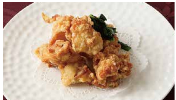
おすすめ 鶏の唐揚げ 600円