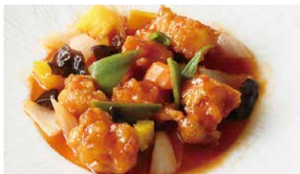
おすすめ パイナップル入り酢豚 1,200円