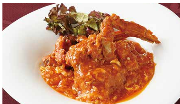
おすすめ 渡り蟹のチリソース 1,350円