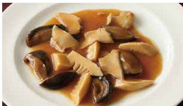
おすすめ あわびの醤油煮込み (3名盛) 6,000円