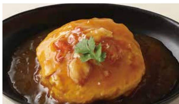
おすすめ 天津飯 1,450円