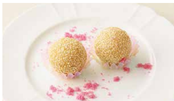
おすすめ 胡麻団子 400円