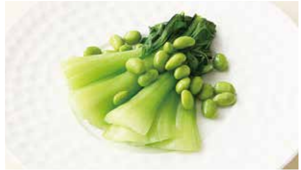
おすすめ 中国野菜の強火炒め 900円