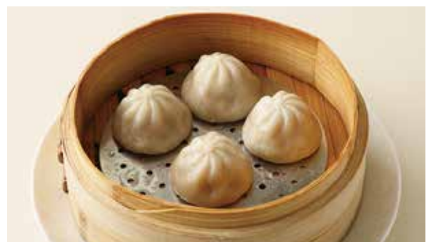
おすすめ 小籠包 600円