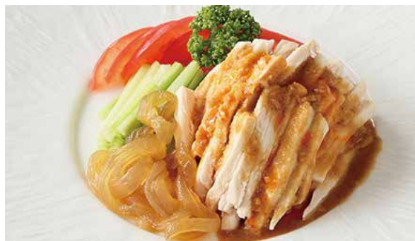
おすすめ 棒棒鶏 (バンバンジー) 900円