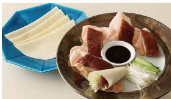
おすすめ 北京ダック 5,500円