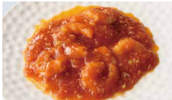
おすすめ 小海老のチリソース 1,200円