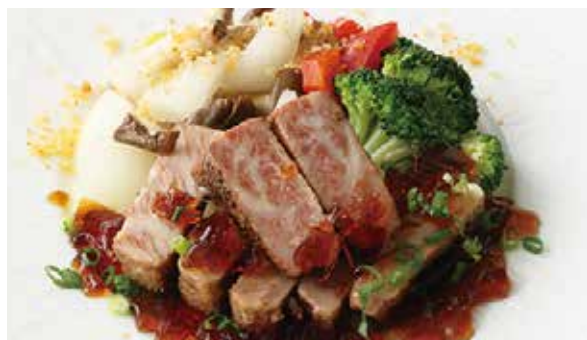
おすすめ みかわ牛ロース肉の煎り焼き山椒ソース 4,000円