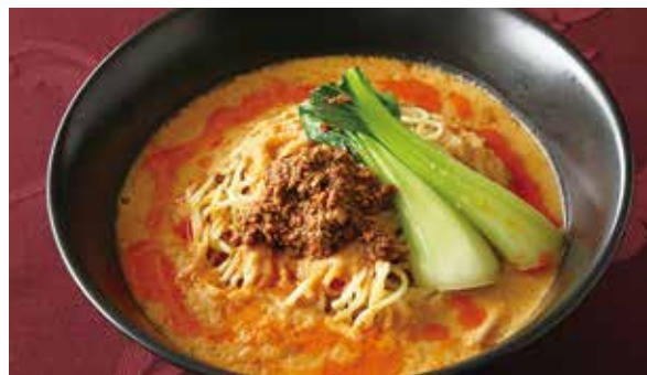
おすすめ 担々麺 1,150円