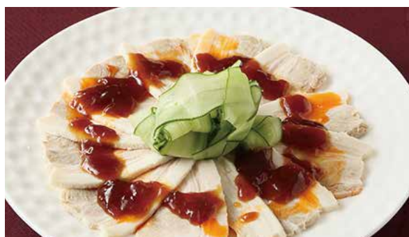
おすすめ 豚肉の蒸し物ニンニクソース 900円