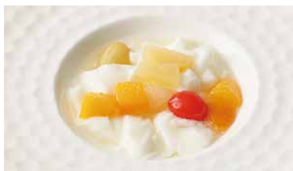
おすすめ やわらか杏仁豆腐 500円