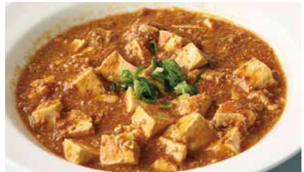
おすすめ 麻婆豆腐 900円