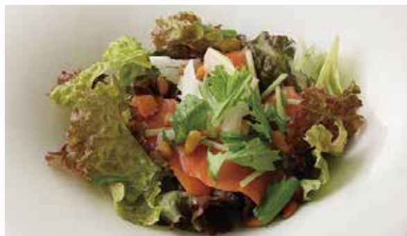
おすすめ 松の実入りサーモンサラダ 900円