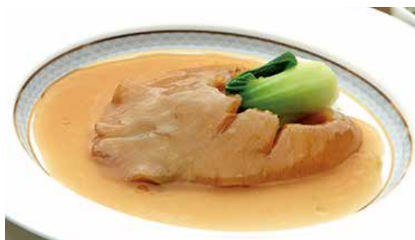
おすすめ 大フカヒレの姿煮込み 15,000円