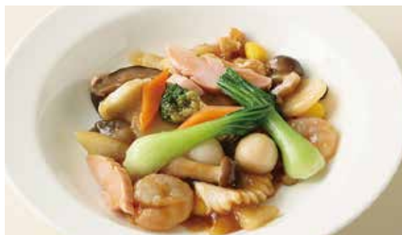
おすすめ 八宝菜 1,400円