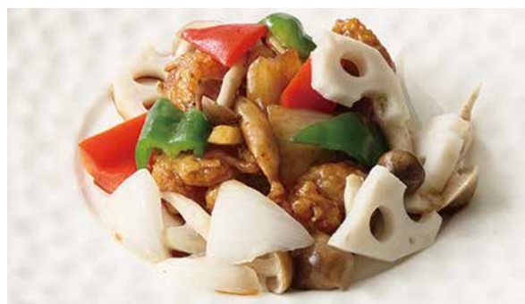
おすすめ ホタテ貝柱の黒胡椒炒め 1,200円