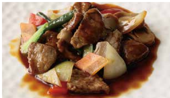
おすすめ 牛肉のオイスターソース炒め 1,200円