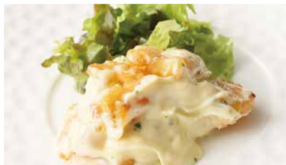
おすすめ 小海老のマヨネーズソース 1,200円