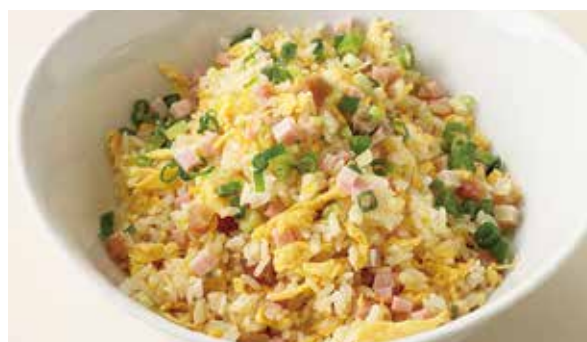
おすすめ 豊華楼炒飯 1,000円