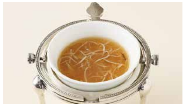
おすすめ フカヒレスープ 1,100円